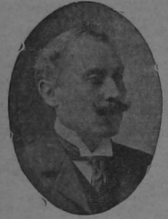
Don Ricardo Fernández Guardia